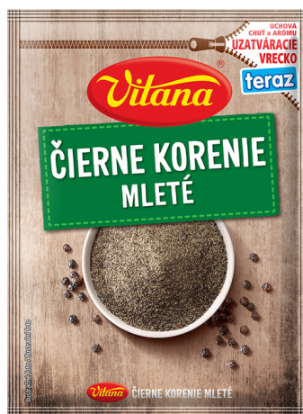
Čierne mleté korenie